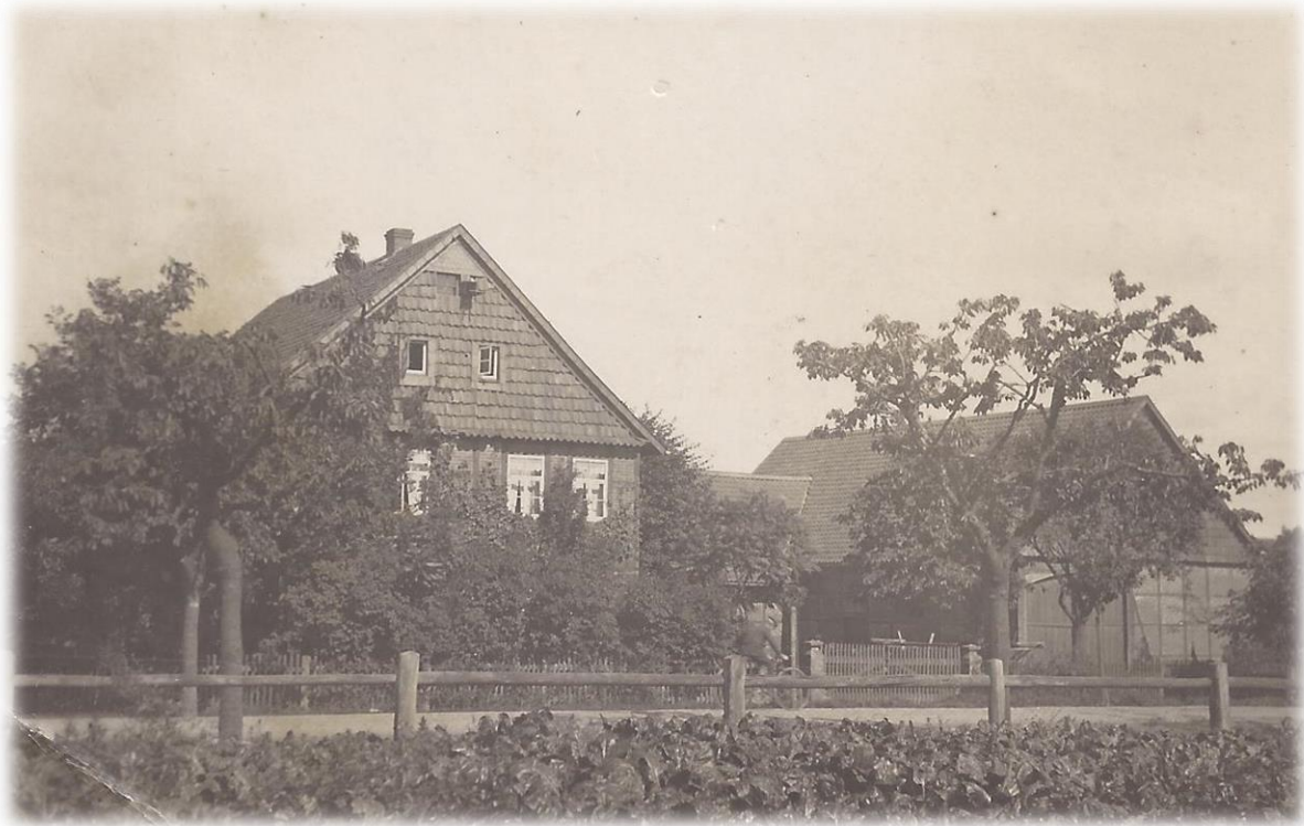
Der Sundermeyersche Hof an der Alten Straße um 1930

„Im Jahre 1882 brannte der Bauernhof des Kothsaßen Theodor Sundermeyer ab. Dieser Hof lag mitten im Dorf am Unsinnbach, nur das Altenteilerhaus blieb erhalten. Da nun dieser Hof in einer engen Dorflage lag, entschloß er sich, den Wiederaufbau auf einem eigenen Grundstück in der Alten Straße vorzunehmen. Dies geschah in den Jahren 1882-1887. Die alte Hoffläche wurde nun als Bauland veräußert. Eine neue Zufahrt wurde geschaffen, der heutige Brunnenweg. Der bis dahin bestehende Dorfweg (Wasserweg) über Papen Grundstück zum Papenbrunnen entfiel. Auf der linken Seite zum Bach hin entstanden 5 Bauplätze.“